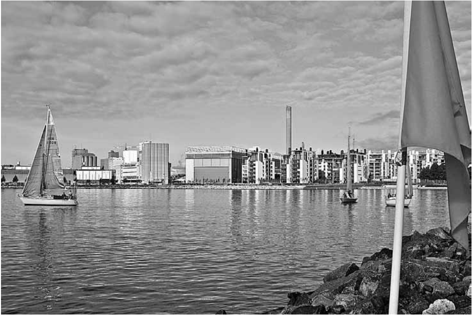
Ei liikahda lippukaan