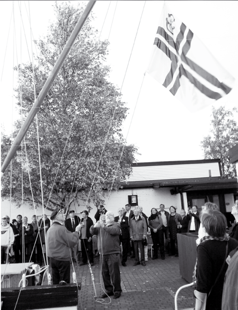
Lipunlasku 2011, kuva Markku Leppävuori.