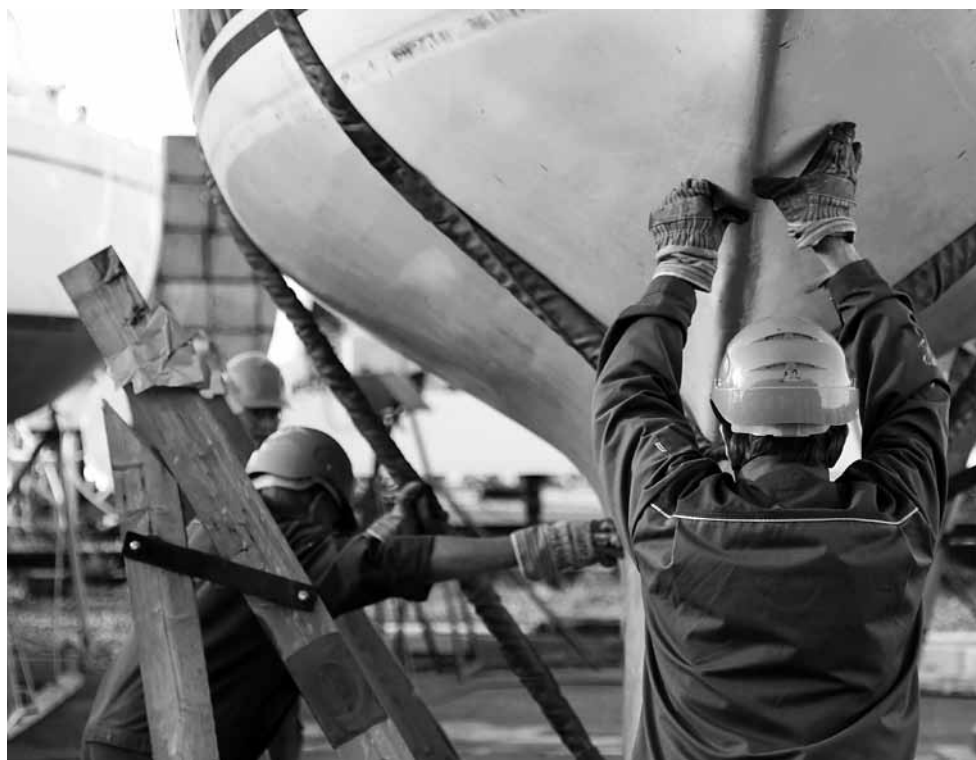
Telakka toimii: köli kohdalleen ja vene vaateriin.