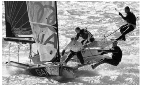
Team Gant