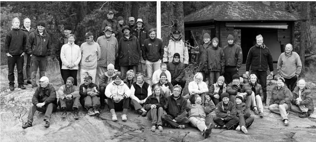
Eskaaderin osanottajat.