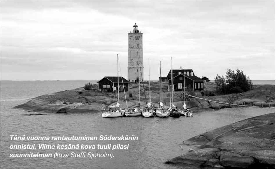
Tänä vuonna rantautuminen Söderskäriin onnistui. Viime kesänä kova tuuli pilasi suunnitelman.

tehtiin uusi laituriennätys. Omassa laituriassa oli 25 venettä! Paikalla oli siis useampi kuin joka viides seuran lipun alle rekisteröidyistä purje- ja moottoriveneistä! Ja lisäksi vielä yksi SPS-vene kiinnittyi talvitelakkansa laituriiin lahden toiselle puolelle.