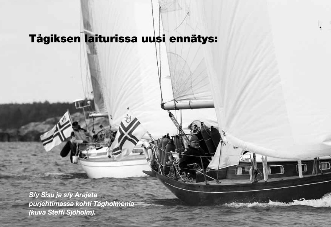
S/y Sisu ja s/y Arajeta purjehtimassa kohti Tågholmenia.