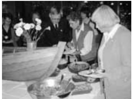
Lipunlaskussa nautittiin Ravintola Saaren erinomaisen Saaristolaispöydän antimista