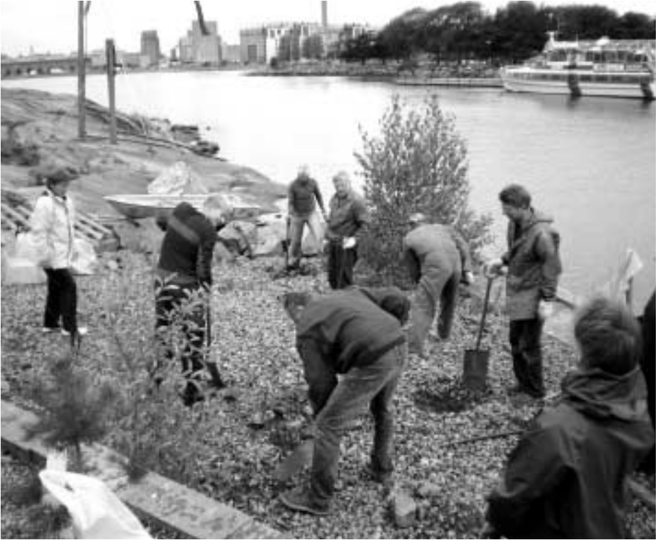
Männynmaitia istuttamassa