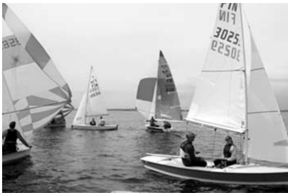
Viklat ja 505:t Helsinki-regatassa 28.-29.6.2008