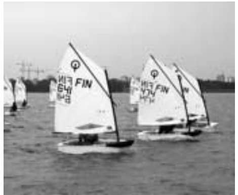
Optimisti-SM 22.-24.8.2008, jossa SPS järjesti yhden radan.