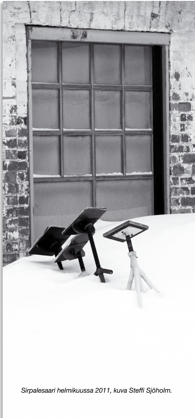
Sirpalesaari helmikuussa 2011