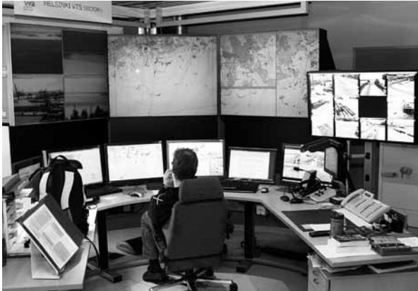
Tältä näyttää VTS:n Helsingin alueen pöytä valvontamonitoreineen.

Keskustelemme myös hälytyksen tekemisestä VHF:llä ja epirbillä. Keskellä Itämerellä voi kestää jopa tunteja epirbin paiskaamisesta mereen ennen kuin apu saadaan paikalle. Se on pitkä aika siinä tilanteessa.