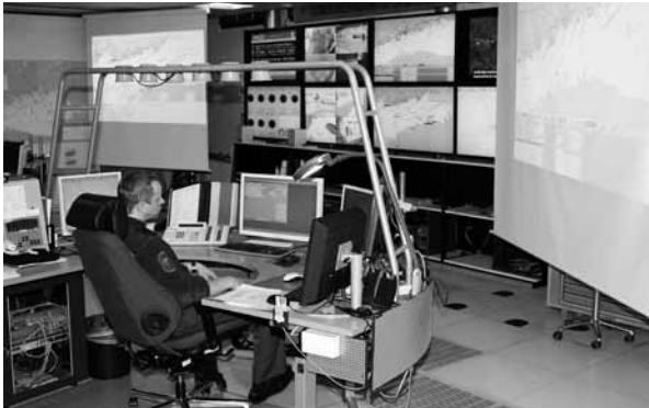
Seinän takana on Rajavalvontalaitos vastaavilla valvontalaitteilla.