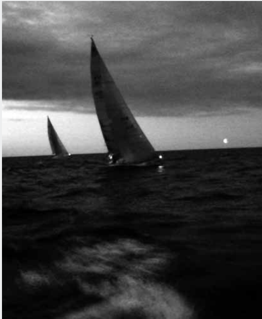
Helsinki Tallinna Race 19.-20.8.2011