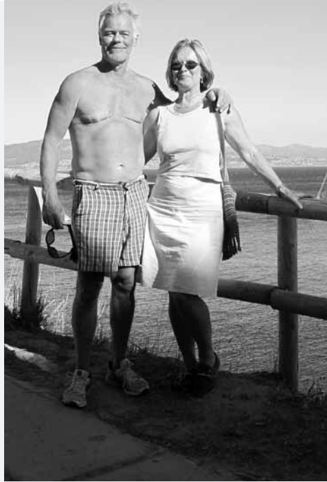
Kapteeni ja miehistö.