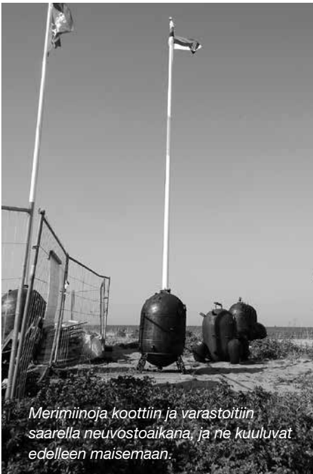
Merimiinoja koottiin ja varastoitin saarella neuvostoajana, ja ne kuuluvat edelleen maisemaan.

teen 1994 ja lähtivät vasta Viron itsenäistymisprosessin loppuvaiheessa. Sen jälkeen saarta on kunnostettu matkailukohteeksi.