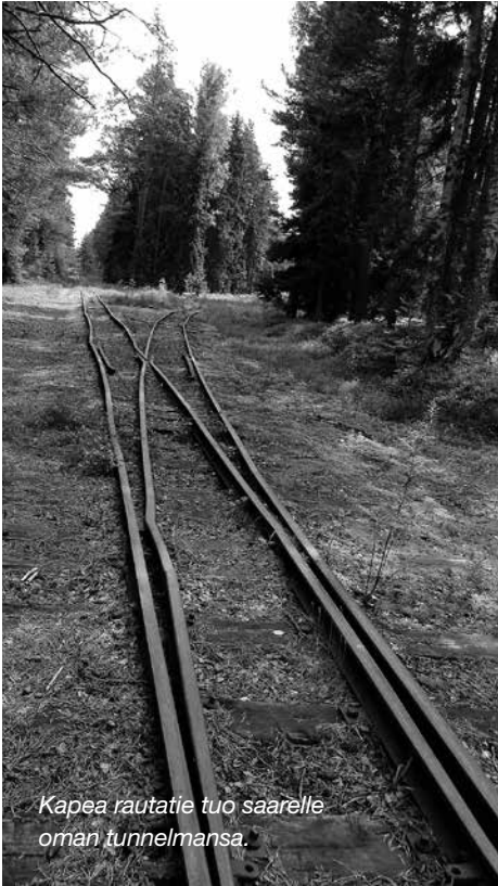
Kapea rautatie tuo saarelle oman tunnelmansa.