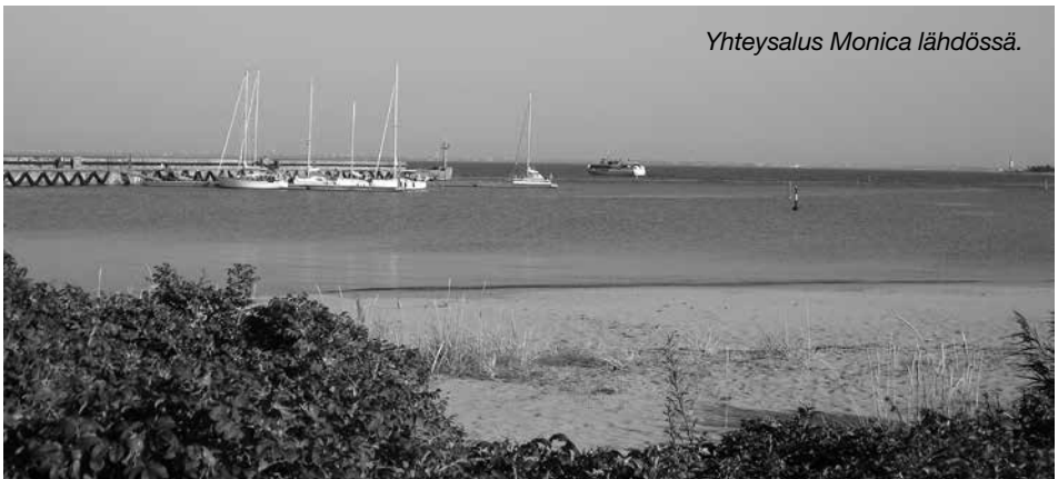
Yhteysalus Monica lähdessä.

Naissaari joutui vuonna 1944 muun Viron lailla vuosikymmeniksi Neuvostoliiton halltuun. Neuvostoaikana saarella valmistettiin ja varastoititiin merimiinoja ja se oli suljettu alue. Venäläiset viipyivät saarella aina vuo-