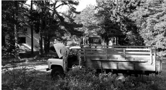
Monet Männikun kylän taloista on tuotu Suomesta sotakorvaukseksi. Osa Enson viipalealoista on kunnostettu ja asuttuja, osa on autiona.

tun kuppilan vieressä. Kenties sinnekin ehtii poikkeamaan ensi kesänä, jos ja toivottavasti kun suunniteltu eskaaderi Naissaaren toteutuu.