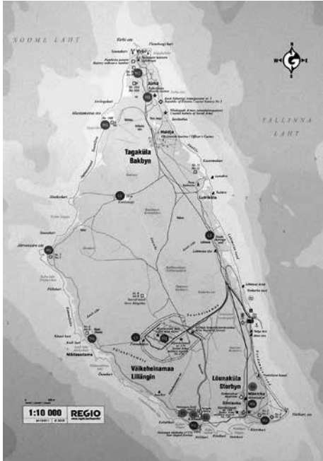
Naissaaren pituus pohjois-eteläsuunnassa on yli 7 kilometriä.