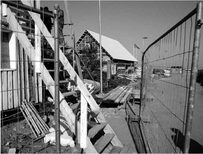
Saarte Liinid -sata- maketjun palvelura- kennukset olivat te- keillä kesällä 2013.

teen 1994 ja lähtivät vasta Viron itsenäistymisprosessin loppuvaiheessa. Sen jälkeen saarta on kunnostettu matkailukohteeksi.