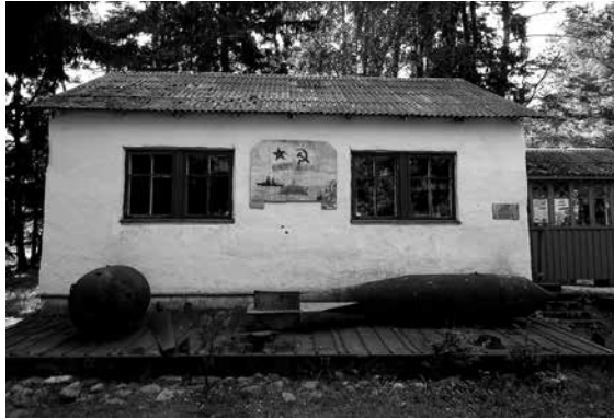
Neuvostoaikainen Rannarahva muuseum sijaitsee Männikun kylässä saaren kaakkoisosassa.