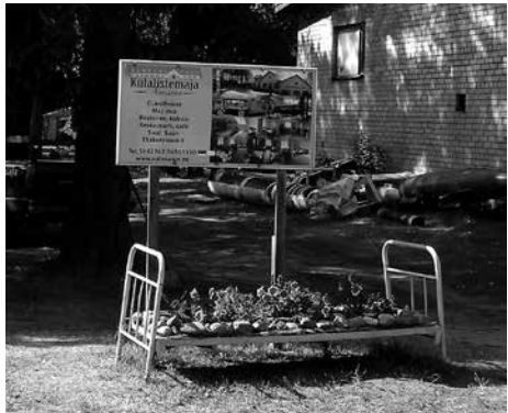
Kälälistemaja tarjoaa erilaisia matkalupalveluita.

Hienolla saarella riittää katsottavaa vaikka monelle päivälle, niin vanhempia historiallisia kohteita kuin luontoakin. Hylättyjä rakennuksia ja kalustoa sekä 37 km pituista junarataa voi ihmetellä pitkin saarta. Kaikin puolin mielenkiintoinen Naissaari on luonnonsuojelualue, josta voi iltaisin ihailia pääkaupungin valoja.