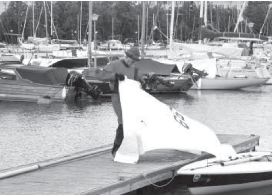
Pekka Taiminen selvittämässä purjetta.