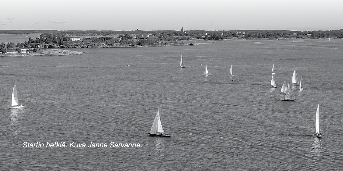
Startin hetkiä.

Lopulta koitti kilpailupäivä ja ilmassa oli kielteittä suurta urheilujuhlan tuntua. Harmi tosin, että tuuli oli täysin olematonta. Sää tiedotus kuitenkin lupaili tuulen hieman voimistuvan iltapäivällä, joten kovin huolisani tilanteesta en ollut. Saapumisilmoittautumisten lomassa seurasi ahkerasti eri tuuliennusteita ja vähitellen huoli kilpailun onnistuneesta läpiviennistä alkoi kasvaa. Jokainen uusi päivitys ennusti yhä vähemmän tuulta ja purjehdusohjeissa ilmoitettu neljän tunnin aikaraja radan kiertämiseen uhkasi tulla vastaan. Mielessä kävi jälleen kerran ajatus, että miksi kaikista maailman lajeista olen päätenyt tällaisen pariin, joka on niin riippuvainen sääolosuhteista. Nyt ei kuitenkaan auttanut kuin pitää pää kylmänä. Purjehdusohjeisiin ei ollut enää mahdollista tehdä muutoksia eikä lähtöjen lykkääminen