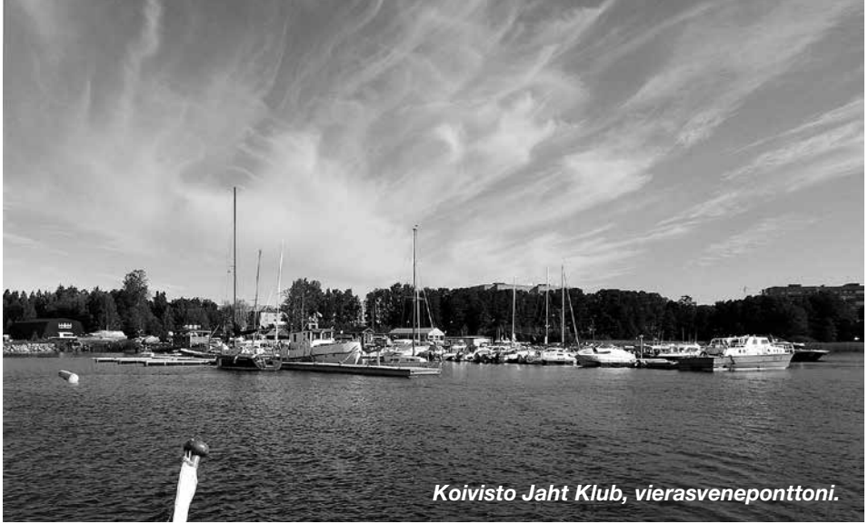
Koivisto Jaht Klub, vierasveneponttoni.

kassa tuulessa vauhdilla sisään tuleva konevikainen pietarilaispursi ”parkkeerasi” eteemme. Pysäytys hoitui ajamalla päin edessä olevaa aisaa.