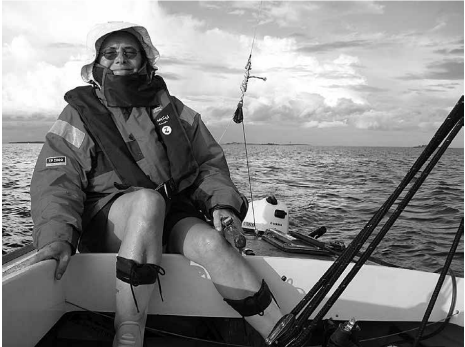
Seiluuta kesällä 2013, vaihtelevissa keleissä.