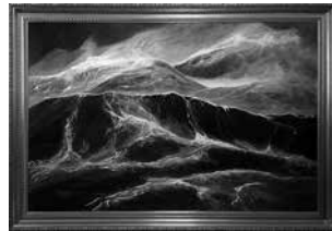
Kansikuva: Maalaus Menneisyyden meri, taiteilija Merihelena Leskinen.