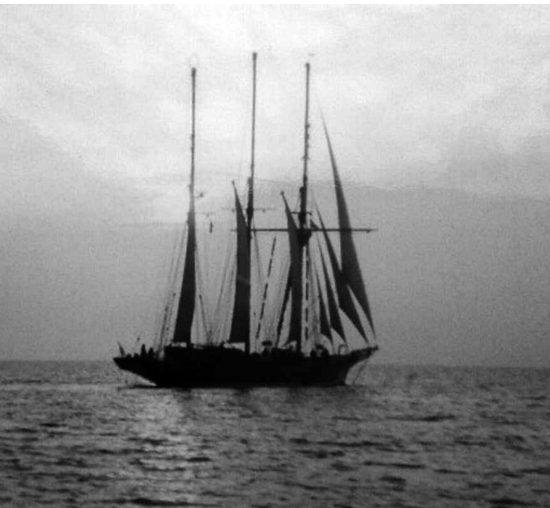
Kielin edustalla vuonna 1984.