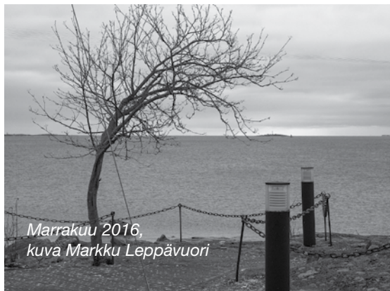
Marrakuu 2016

Tervetuloa vaihtamaan ajatuksia Sirpalesaaren ja Merisataman valmisteilla olevasta asemakaavasta. SPS tulee jättämään oman ehdotuksensa Helsingin kaupunkisuunnitteluvirastolle. Ehdotus valmistellaan kevätkokouksessa jäsenistölle esiteltäväksi. Tilaisuuden järjestää SPS:n hallitus/kaavatyöryhmä.