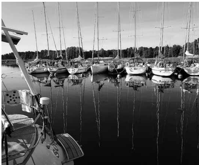
Avomerieskaaderi purjehdittiin Viron Prangliin.