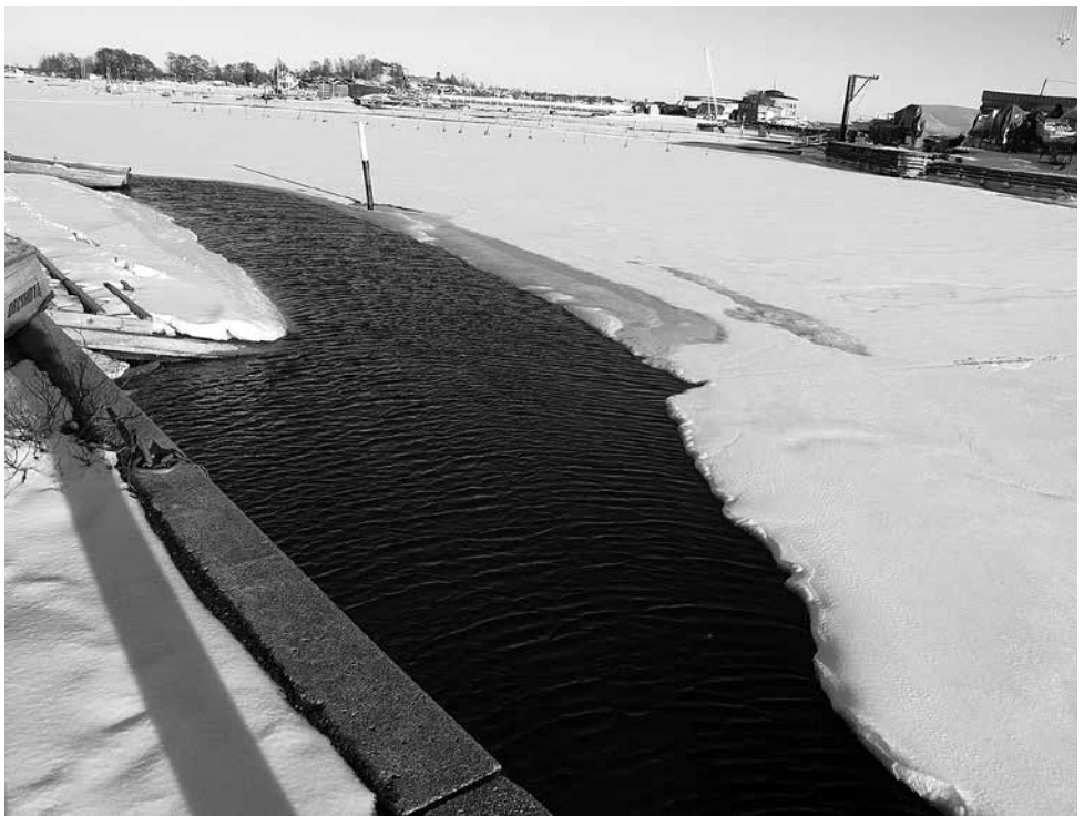
Jäätilanne 3.4.2018.