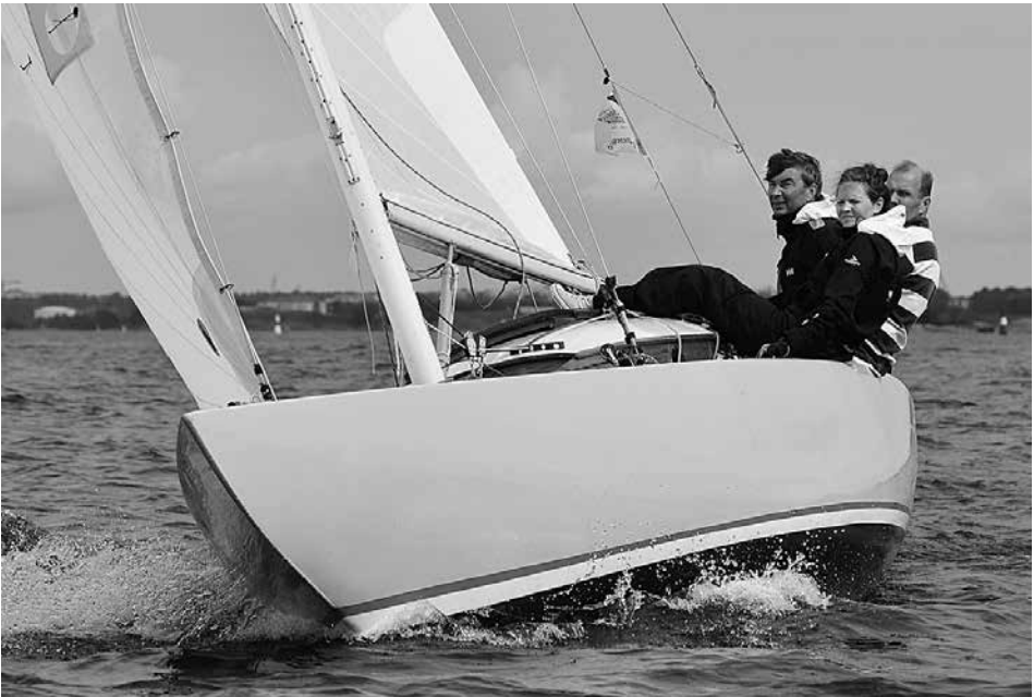
A, FIN-8, Bellona

Yksi tärkeä kilpailevien klassikkovene- luokkien aktiivisuuden ja jatkumon mittari on luokkakohtaiset SM-kilpailut. Tällä hetkellä vielä ainakin Kansanvene, 6mR ja Hai -luokissa on SM-statukseen tarvittavat 20 venettä saatu lähtöviivalle – toivottavasti näin on myös tulevina vuosina.