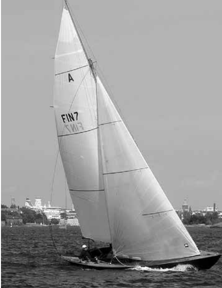
A, FIN-7, Kismet