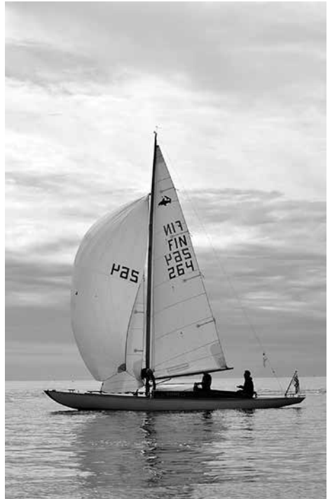
Hai, FIN-264, Myrskylintu

Yksi merkittävä tekijä näiden kaunottarien aktiivisuuden takana on mahtavat puitteemme veneiden keväthuoltoon ja talvisäilytykseen. Lisäksi se auttamisen ja yhteistyön henki, jota vajassa nautimme, ei jätä ketään pulaan, olipa kyse kuinka vaikeasta korjaustoimenpiteestä tahansa. Jou-