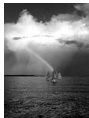
Kannen kuva: Kesän ensimmäinen junnuleiri purjehtii.